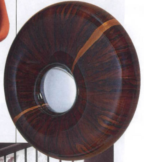
MIROIR « Ziricote Shine » en ziricote, diam. 65 cm, Stéphanie Coutas.