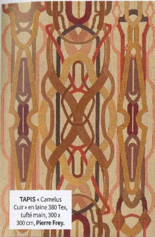
TAPIS « Camelus Cuir » en laine 380 Tex, tufté main, 300 x 300 cm, Pierre Frey.