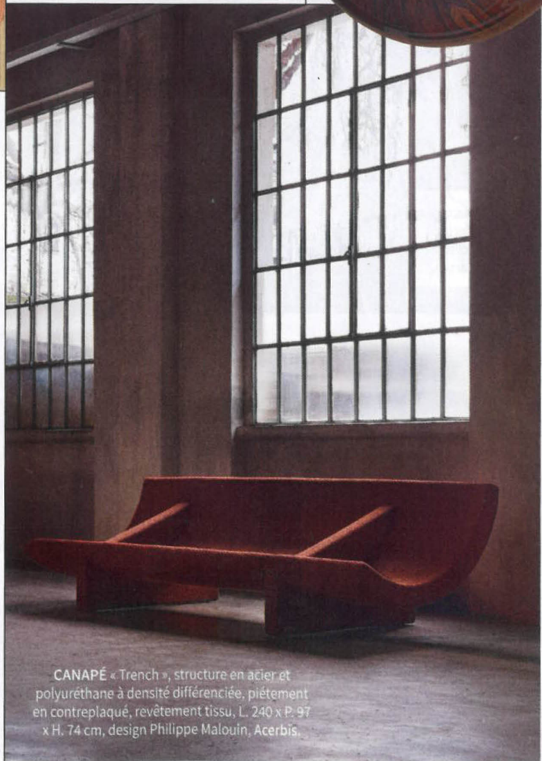
CANAPÉ « Trench » , structure en acier et polyuréthane à densité différenciée, piétement en contreplaqué, revêtement tissu, L. 240 x P. 97 x H. 74 cm, design Philippe Malouin, Acerbis.