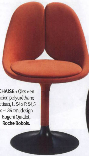
CHAISE « Qiss » en acier, polyuréthane et tissu, L. 54 x P. 54,5 x H. 86 cm, design Eugeni Quitllet, Roche Bobois.