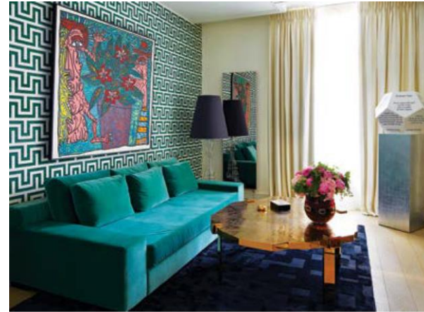
Place Des Etats Unis