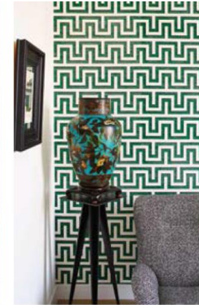
Place Des Etats Unis

ІНТЕР'ЄР ВІД СТЕФАНІ КУТАС ВИРІЗНЯЮТЬ ЛЕГКІ М'ЯКІ КОЛЬОРИ, ЧИСТІ ЛІНІЇ І ВРАЖАЮЧИЙ ДЕКОР. ОСТАННІЙ ПРЕДСТАВЛЕНИЙ РІЗНИМИ СОРТАМИ МАРМУРУ, КРИШТАЛЕМ, ШТУЧНО ЗІСТАРЕНИМ ПОТЕРТИМ ОКСАМИТОМ, ШОВКОМ І ЦІННИМИ ПОРОДАМИ ДЕРЕВА