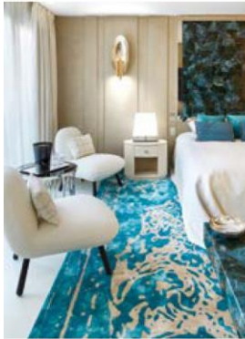
Penthouse in Cannes