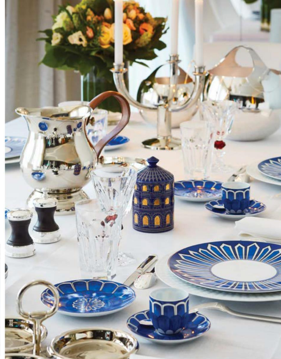
Dining room at the Penthouse in Cannes