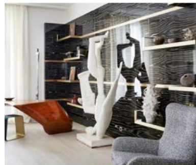
Place des estats unis

УНІКАЛЬНІСТЬ ДИЗАЙНУ СТЕФАНІ КУТАС У ТОМУ, ЩО ВІН БІЛЬШЕ НАГАДУЄ ПРОСТОРУ ГАЛЕРЕЮ СУЧАСНОГО МИСТЕЦТВА, ДЕ КОЖЕН ПРЕДМЕТ Є ЗАГАЛЬНОВИЗНАНИМ ШЕДЕВРОМ У СВІТІ ПРЕДМЕТНОГО ДИЗАЙНУ