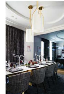
Place Des Etats Unis

Текст – Євген Слущкий