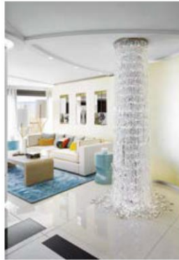
Penthouse in Cannes

невеликої барної стійки з алебастру примостився барний стілець з плетеної шкіри від Mark Albrecht. У вітальні на підлозі килим дизайну SC Edition для Tai Ping, світлі дивани Léonard від Minotti, доповнені двома м'якими кріслами Dickens від Montis, з оббивкою блакитного оксамиту і дерев'яними більцями. Більшість меблів та інших елементів декору і в вітальні, і в інших кімнатах були виконані дизайнерами SC Edition, Maison Porineau, Alain Elouz, Ludovica Mascheroni. Вікна оформлені легкими шторами Fabric Sumika from Larsen, на журнальному столику – синя ваза від Marc Albert.