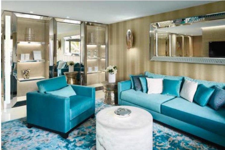
Penthouse in Cannes